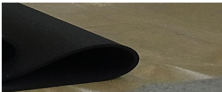
Obr. 2: Instalace podlahy SPORTEC®