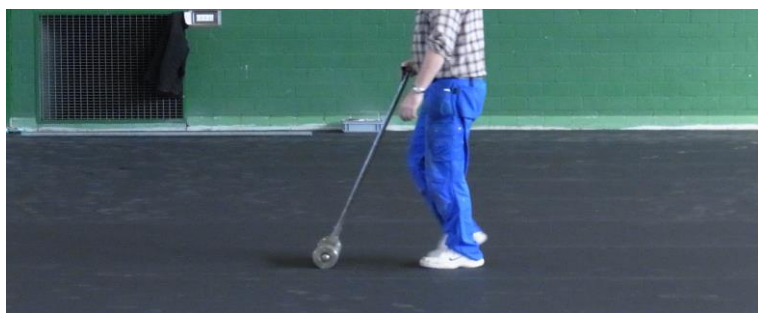
Obr. 3: Přitlačení podlahy SPORTEC® k podkladu