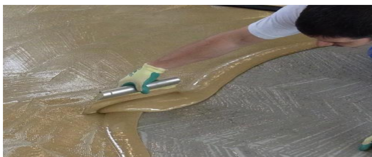
Obr. 1: Lepidlo nanášejte na suchý a rovný podklad

Při aplikaci speciálního dvousložkového PU lepidla se řiďte pokyny od výrobců materiálů. Lepidla pro lepení podlahy SPORTEC®color aplikujte pouze na suchou a čistou podlahu. Po instalaci nevstupujte na podlahu, dokud lepidlo úplně nezaschne. Stejným způsobem postupujte v případě povrchové úpravy. Před aplikací nátěru zkontrolujte, že je podlaha čistá. Pokud je to nutné, před aplikací ji vysajte. Nevstupujte na podlahu, dokud nátěr zcela nezaschne (min.24 hodin po pokládce).